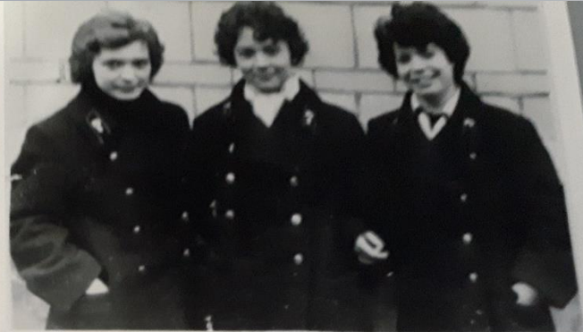
Учащиеся спецнабора училища № 5 – будущие полиграфисты