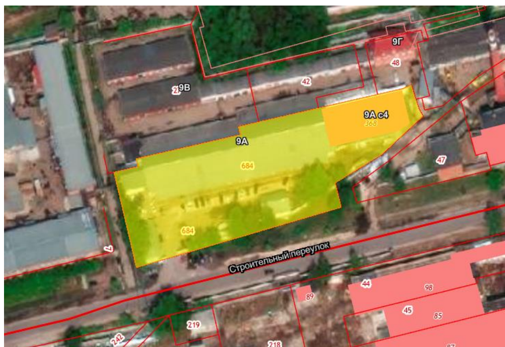
Рисунок 2 - Ортофотоплан рассматриваемой территории.