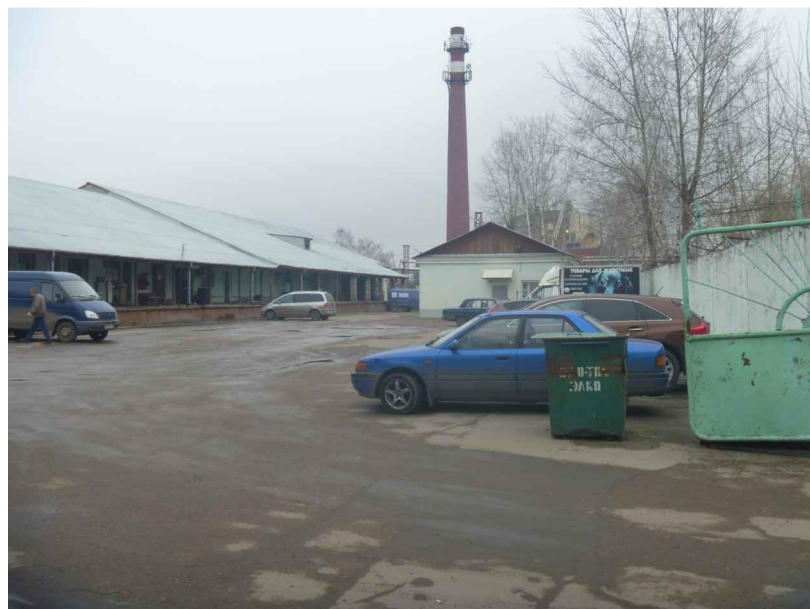
Вид на участок с юго-западной стороны