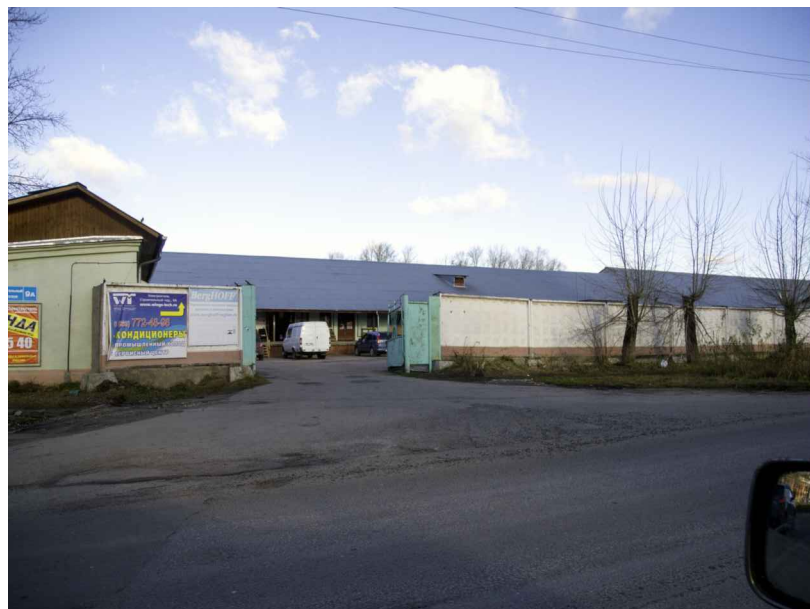
Вид на участок с южной стороны