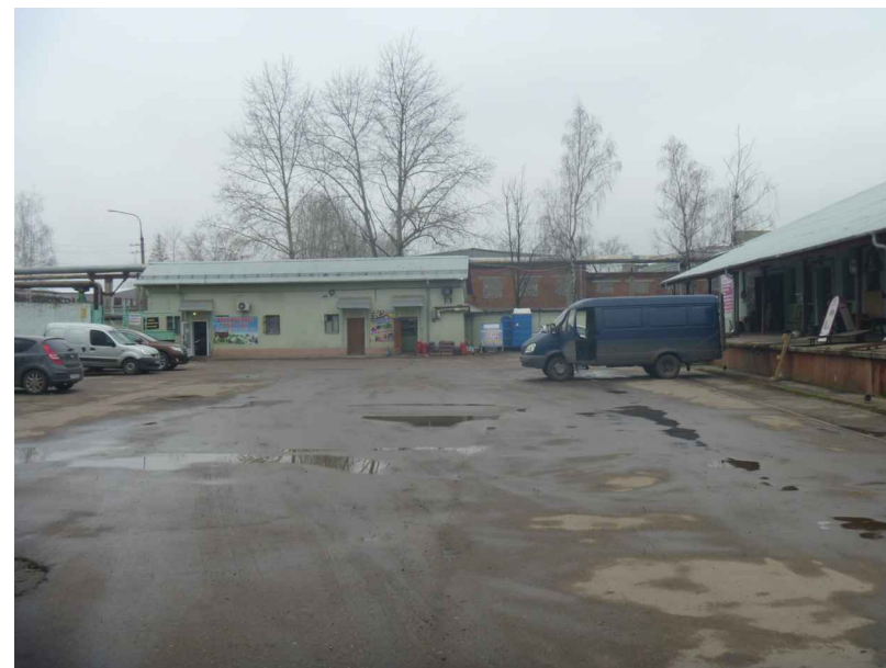
Вид на участок с восточной стороны