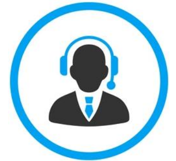
Персональный менеджер ФСС

+ Страхователь может подать жалобу в личном кабинете ФСС