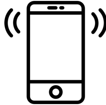
Горячая линия Фонда